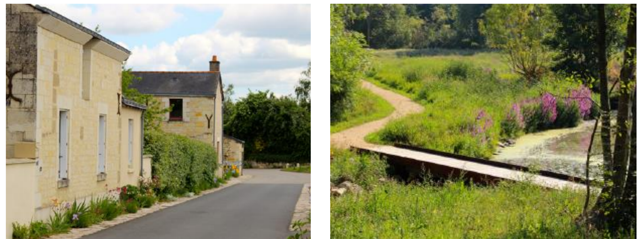
Exemples de calades plantées et de pontons bois

Le projet s'attache à conserver la mémoire du site à travers l'étude d'une réinstallation hydroélectrique (micro-turbine) dans l'objectif d'alimenter l'éclairage de la sente piétonne.